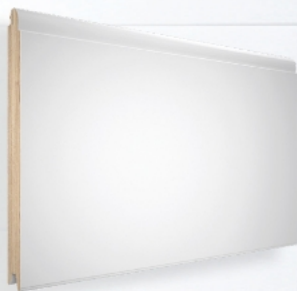
panel bez przetłoczeń