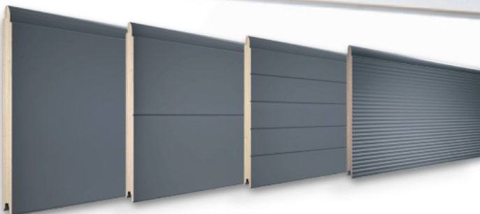
panel bez przetłoczeń